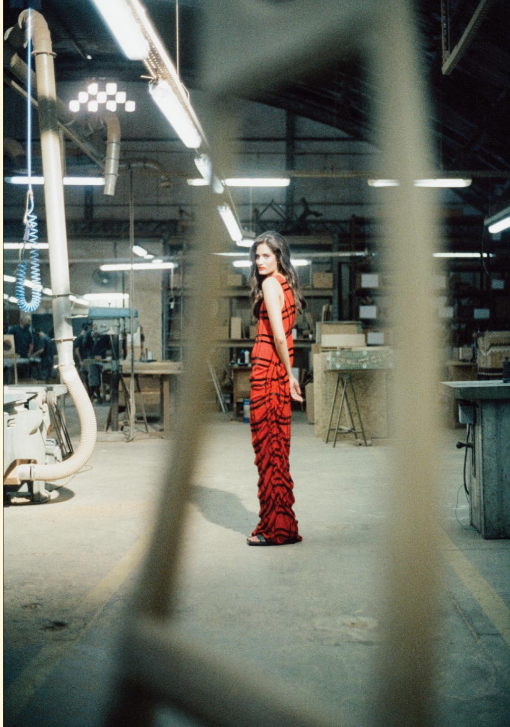
← Vestido Seda Vermelho Bordado Cuiabá Desenho de André Namitala → Idem

→ Vestido Seda Vermelha Recorte a laser + bordado