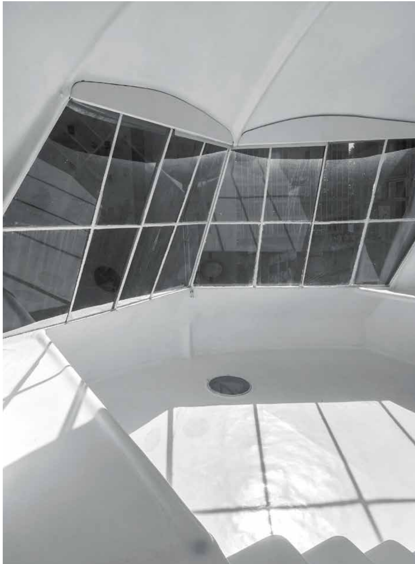
Vistas da sala de estar do Casa Bola