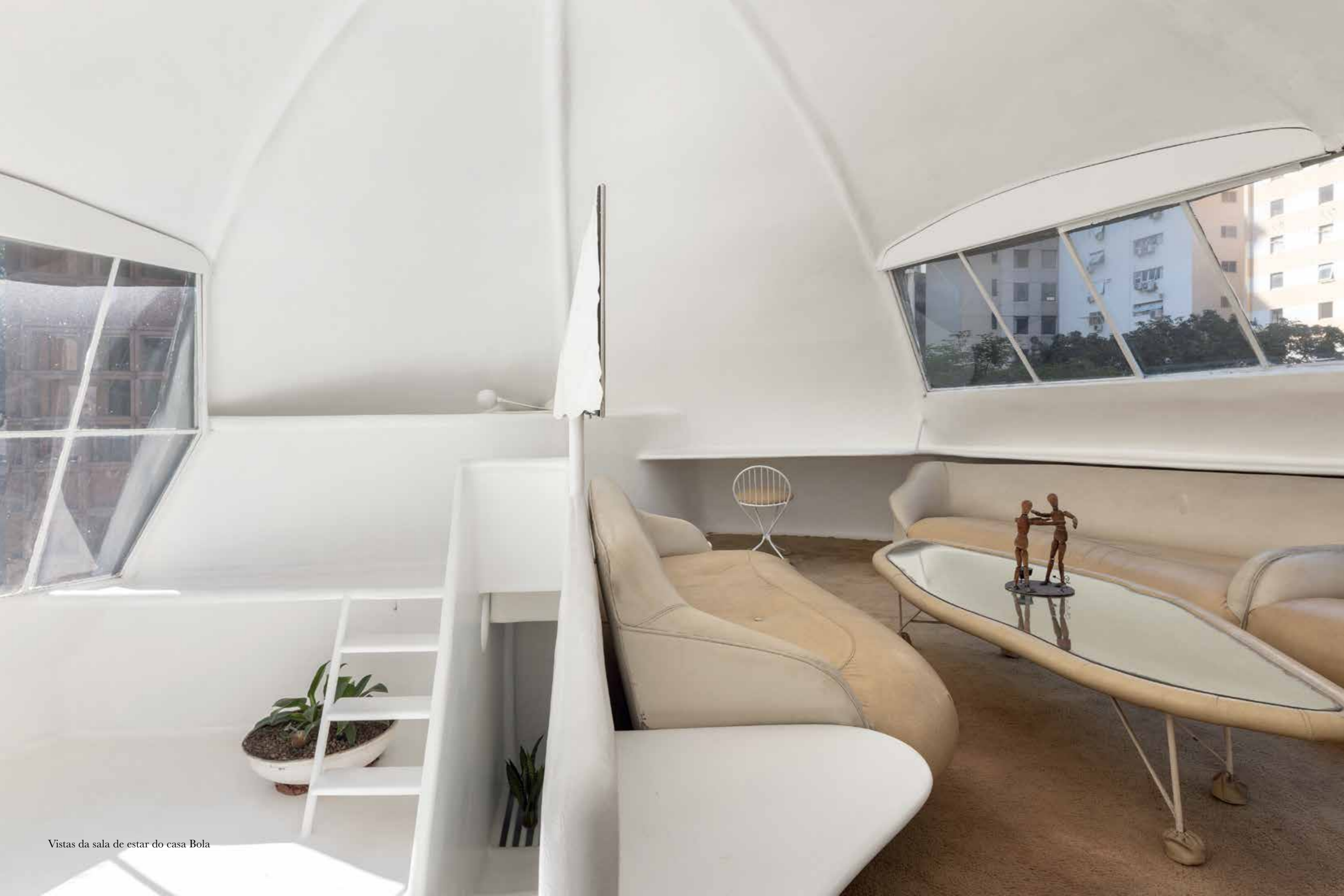
Vistas da sala de estar do casa Bola